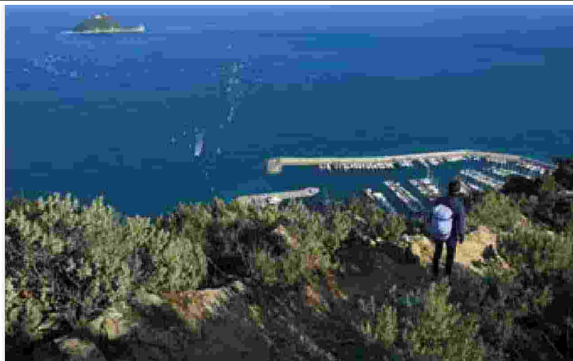
Il territorio offre numerose opportunità di trekking

tel +39 0182 647027 (Ufficio lat) www.visitalassio.eu